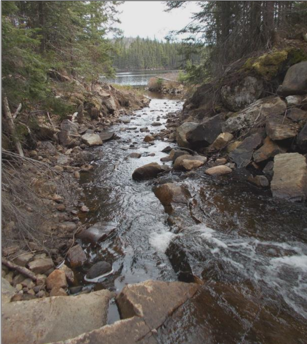
Référence : Émissaire de l'obstacle à la migration du poisson (OMP) du projet de restauration des lacs Doucet, Cossette et Fer à cheval